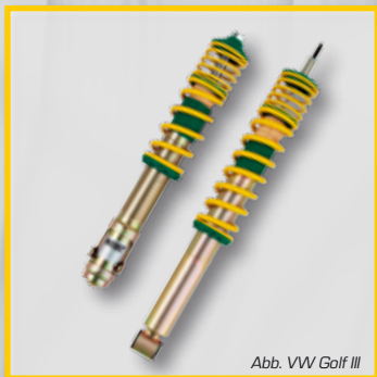
Abb. VW Golf III