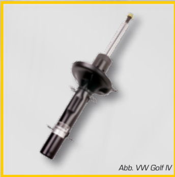
Abb. VW Golf IV