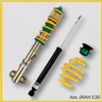
Abb. BMW E36