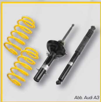
Abb. Audi A3